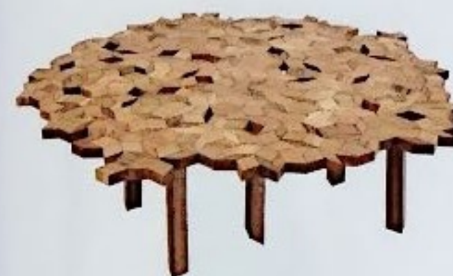
KÜNSTLERISCH Tisch Umbrä besteht aus 500 einzelnen, von Hand gefertigten Holzprismen; 1.066 Euro, von Rukotvorine