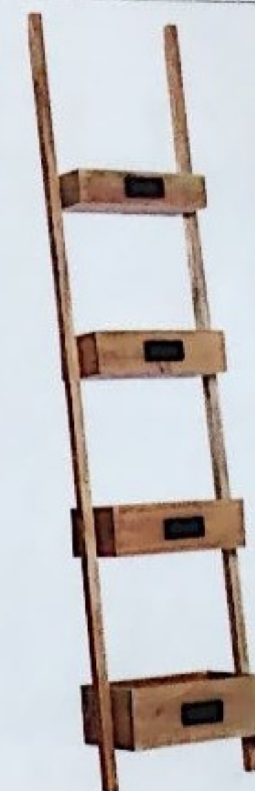
SCHLANK Das schmale Regal macht sich nützlich, wo viel Staufläche auf wenig Raum benötigt wird; 110 Euro, von Hübsch