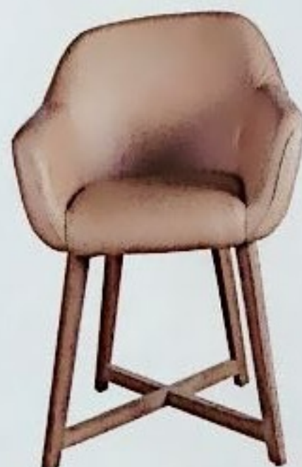
NATÜRLICH Stuhl Anzano ist eine elegante Mischung aus weichem Leder und robustem Eichenholz; 975 Euro, von Flamant