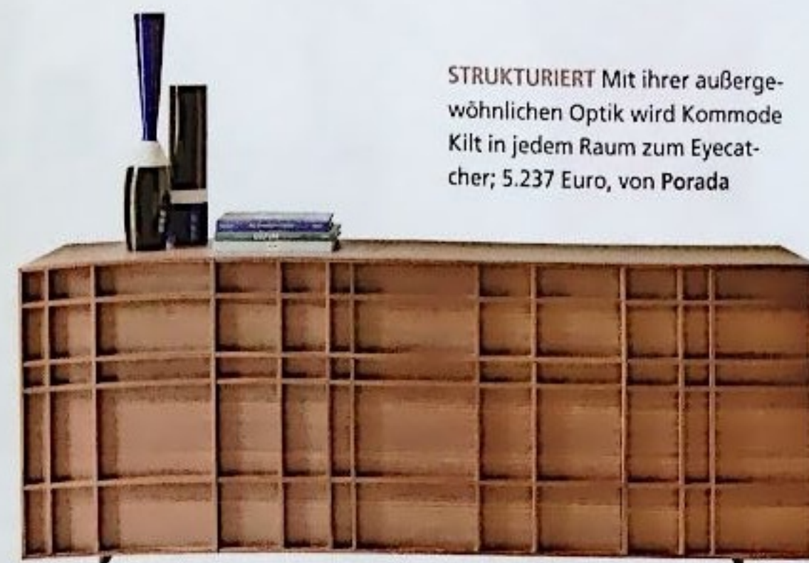
STRUKTURIERT Mit ihrer außergewöhnlichen Optik wird Kommode Kilt in jedem Raum zum Eyecatcher; 5.237 Euro, von Porada

Ein Stück NATUR in den eigenen vier Wänden, davon träumen wir alle. Diese exklusiven Möbel aus NATURMATERIALIEN verleihen Ihren Räumen Charakter.