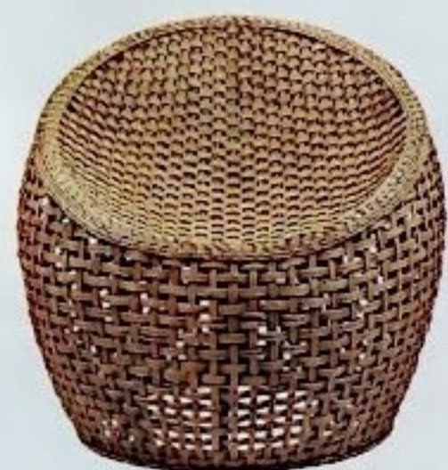
FLECHTWERK Der stylische Dia Lounger ist von Hand aus Rattan gewebt und passt in jeden Raum; 260 Euro, von Puji