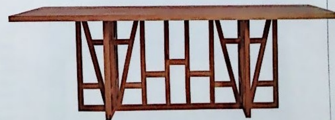
ARCHITEKTONISCH Der massive Tisch Fachwerk kann in sechs verschiedenen Hölzern geliefert werden; 250 x 100 cm, 2.226 Euro, von Vitamin Design