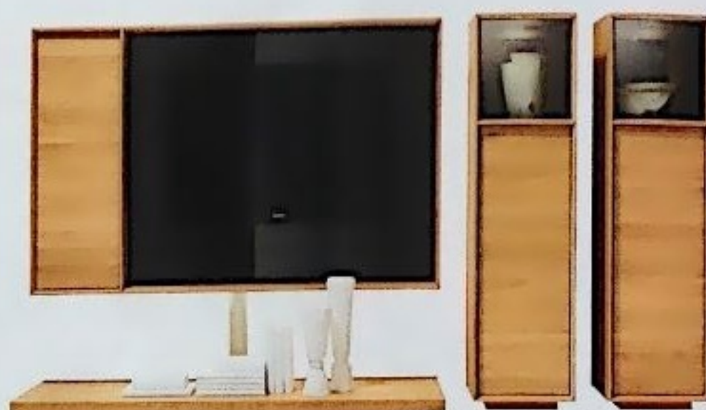
VIELSEITIG TV-Element Lux integriert Fernseher und andere Objekte mühelos in den Wohnbereich; 143 x 297 x 56 cm, 6.818 Euro, von Team 7