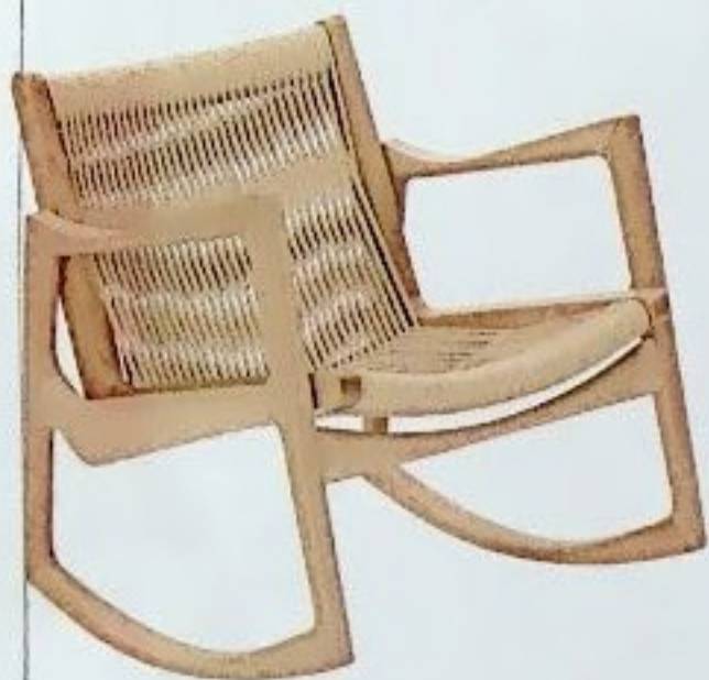
LÄSSIG Kordelbespannte Flächen verleihen Schaukelsessel Euvira eine besondere Leichtigkeit; 2.290 Euro, von ClassiCon