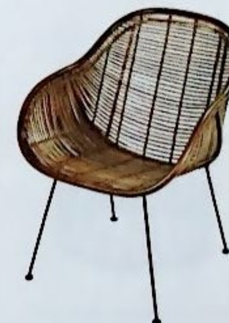
GROSSZÜGIG Stuhl Arne aus gebeiztem Bambussplitt mit Metallgestell wirkt edel und elegant; 349 Euro, von Lambert