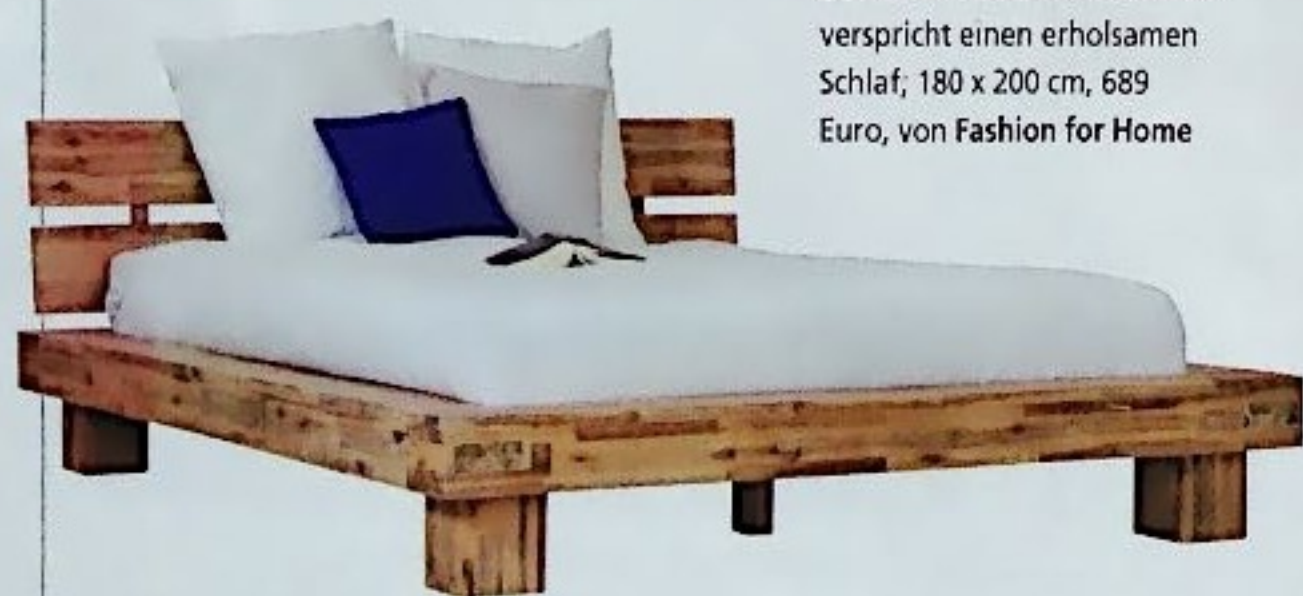
NACHTRUHE Das rustikale Bett Zinnia II aus Akazienholz verspricht einen erholsamen Schlaf; 180 x 200 cm, 689 Euro, von Fashion for Home