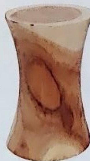
GESCHWUNGEN Der formschöne Hocker aus Massivholz lässt sich auch wunderbar als Beistelltisch verwenden; 99 Euro, von Hübsch

Ein Stück NATUR in den eigenen vier Wänden, davon träumen wir alle. Diese exklusiven Möbel aus NATURMATERIALIEN verleihen Ihren Räumen Charakter.